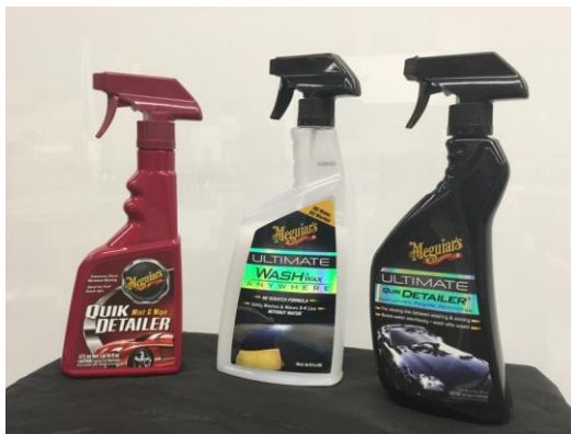
Figure 2 : Produits de finition Meguiar's® recommandés

Meguiar's® propose une variété de produits de finition tels que ceux illustrés à la figure 2. Avant d'utiliser l'un de ces produits ou l'une de ces procédures, testez-les et approuvez-les sur une zone peu visible du film avant de les utiliser sur l'ensemble du covering.